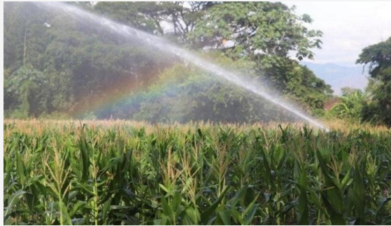
DISTRITO DE RIEGO PARA LAS PROVINCIAS DEL CALLEJÓN DEL RÍO GRANDE DE LA MAGDALENA

Políticas, planes, programas y proyectos de carácter regional para el fortalecimiento de las cadenas agropecuarias y forestales.