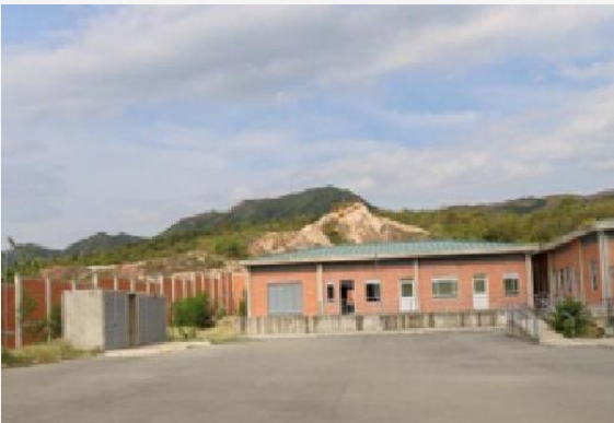
CENTRO DE ATENCIÓN ESPECIALIZADA CAE BARZALOSA SISTEMA DE RESPONSABILIDAD PENAL PARA ADOLESCENTES - SRPA

RM. contrarrestando la fragilidad social .